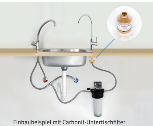
Einbaubeispiel mit Carbonit-Untertischfilter

Ich möchte mich bei Ihnen auf diesem Weg recht herzlich für ein echtes Stück Lebensqualität bedanken. Ich benutze Ihre Produkte mittlerweile seit mehr als zwei Jahren. Sie wissen von meinem Wunsch mich möglichst natürlich zu ernähren, und ich kann heute wirklich sagen, dass ich mich mit meinem Wasser sehr sicher fühle. Mit meinem Untertischfilter bin ich bis heute ausgesprochen zufrieden. Den „Frischekick“ des UMH Wirblers genieße ich wie am ersten Tag. Ich möchte heute kein anderes Wasser mehr trinken.