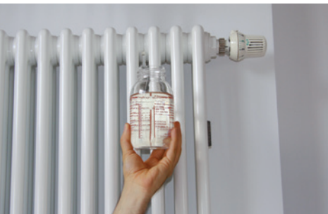
HEIZUNGSWASSER MIT UMH

Diese saubere Wasserqualität wirkt sich erfreulicherweise auch in einer verbesserten Wärmeübertragung im Heizungssystem aus. Das Raumklima hat sich seit dem Einbau der Heat-Geräte ebenso deutlich verbessert und die Bewohner fühlen sich in ihren Wohnbereichen sehr wohl.