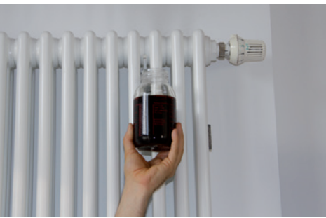
HEIZUNGSWASSER OHNE UMH

Gerne möchten wir über die Erfahrung mit den UMH-Heat-Geräten, welche wir in unsere zwei großen Häuser im Frühjahr 2011 eingebaut haben, berichten. Kürzlich wurden wiederum Wasserproben aus dem Heizungssystem entnommen. Wie schon bei früheren Inspektionen zeigte sich, dass das Heizungswasser völlig klar und schmutzfrei ist.